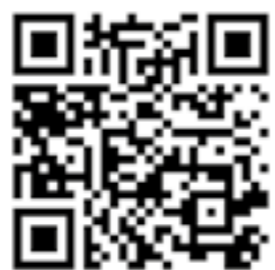
QR-Code zum virtuellen Rundgang durch Bad Salzuflen.